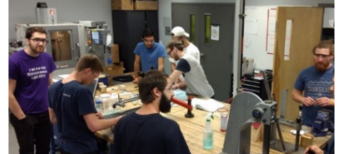
Environnement de Createk

L'étudiante ou l'étudiant évoluera au sein du groupe de recherche Createk ( www.createk.co ), avec 9 profs, 15 professionnels, 1 technicien et plus de 70 étudiants, tous passionnés par le développement de nouvelles technologies pour les machines de demain. Au jour le jour, l'étudiante ou l'étudiant travaillera avec l'équipe ramjet, composée de 6 autres étudiants gradués et 5 ingénieurs dans le nouveau bâtiment d'Exonetik situé dans le quartier industriel de Sherbrooke.